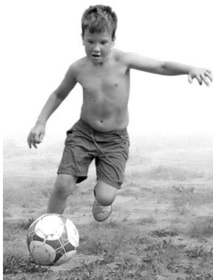
соревнования по футболу