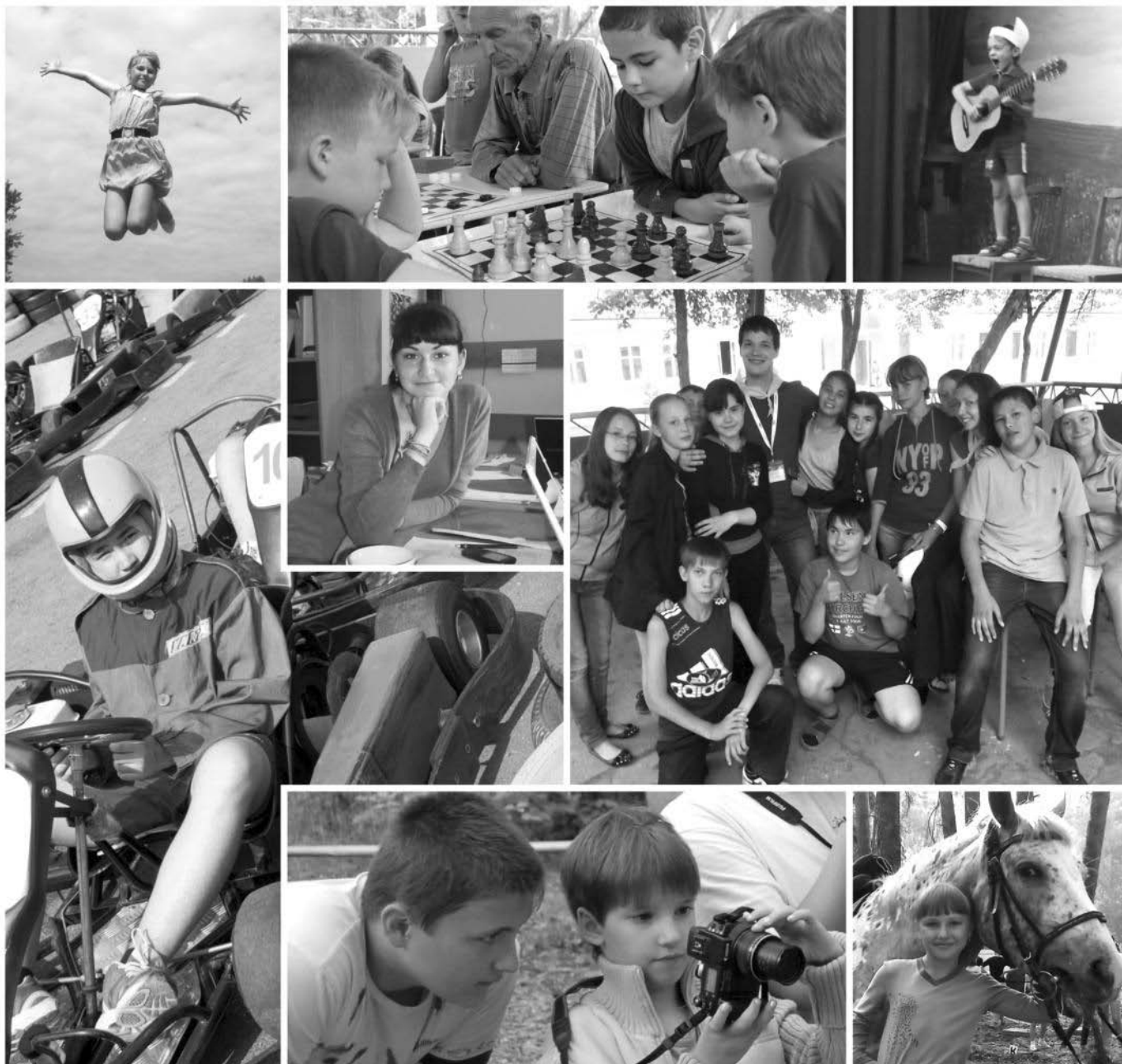
Летний лагерь для детей «Урал». 2 смена 2012 год.

действует на базе ДОК «Уральская березка» учреждение ОАО «ЧМК»