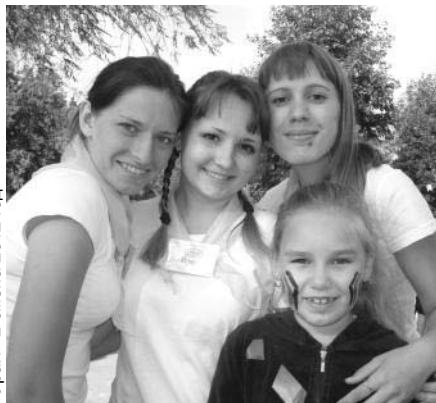
«Урал» 2 смена 2012 год