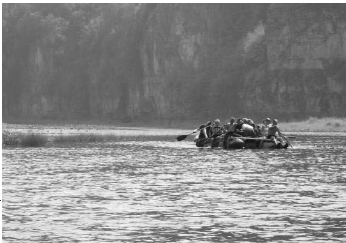
сплав по реке Ай

И пусть в походе было трудно, нам всё равно было весело. Всё-таки подниматься в гору - это как до соседнего города идти, непросто. Но я рад, что сходил в поход. В следующем году приеду на третью смену и снова пойду. Такой поход даёт хорошее настроение, силы и уверенность, что я могу и дальше пойти, не буду отставать и устывать.