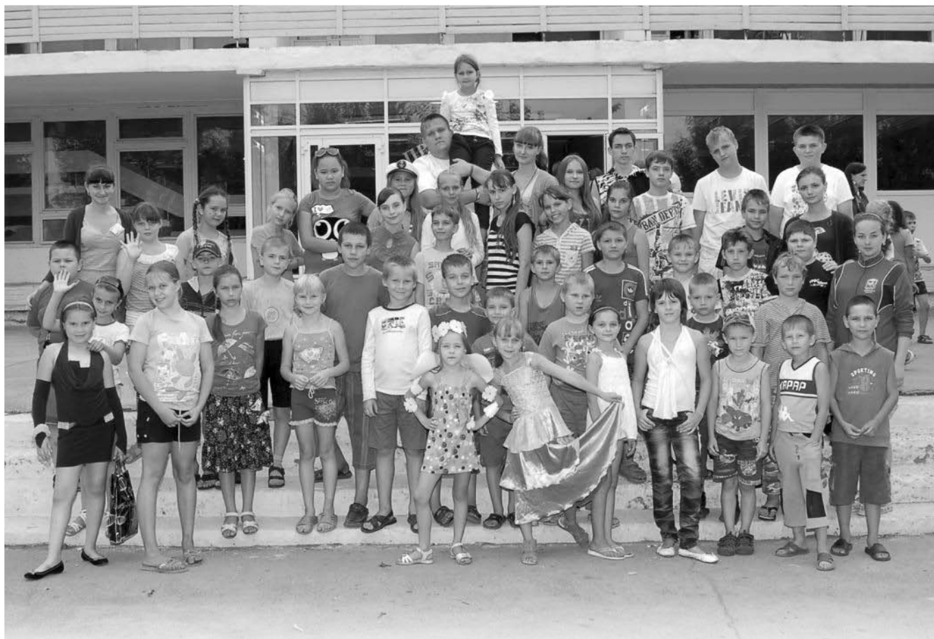
лагерь для детей «Урал» 3 смена 2012 года

действует на базе ДОК «Уральская березка» учреждение ОАО «ЧМК»