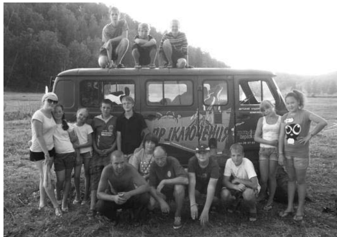
вторая экспедиция 2012 года